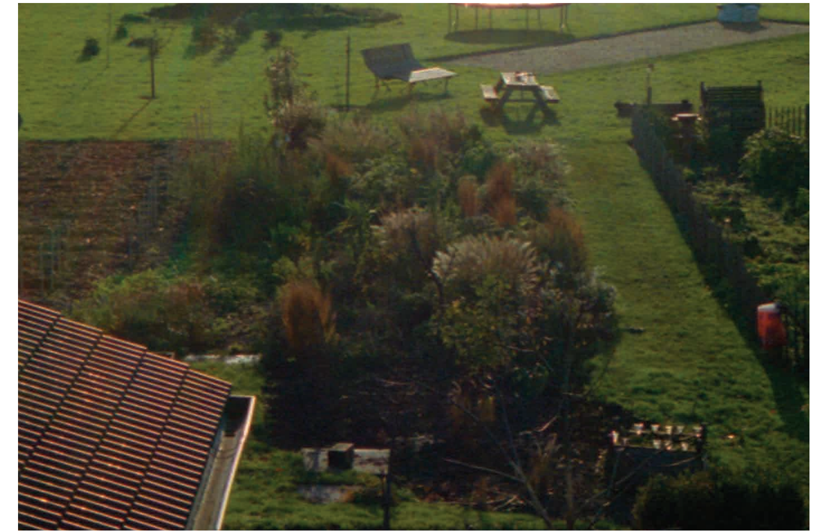
Plot project Aalsmeer, 2019 till now, ongoing material research project in gardening and plants