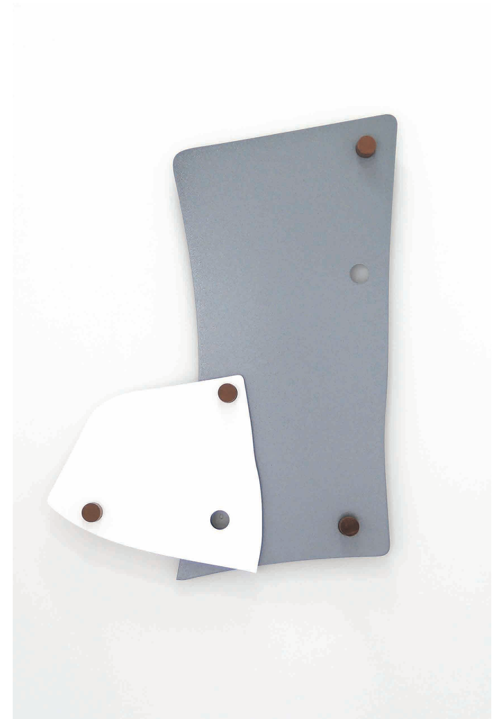
Move 13, from the series Shapeshifters 110cm x 75cm Cold-formed steel, Powder coat, Meranti wood 2020