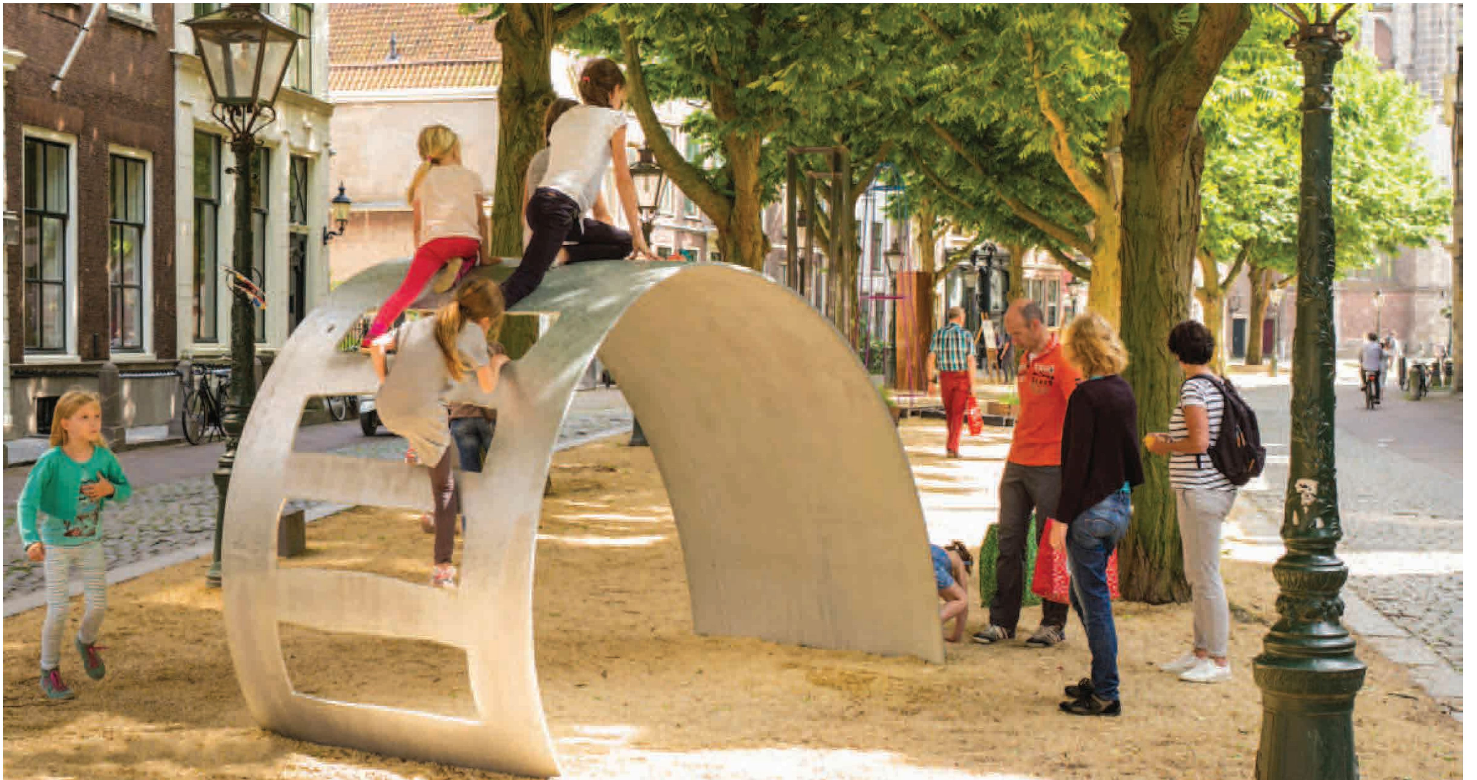
U, Sculpture for Beelden in Leiden 2017, galvanized steel, 300x187x140 cm