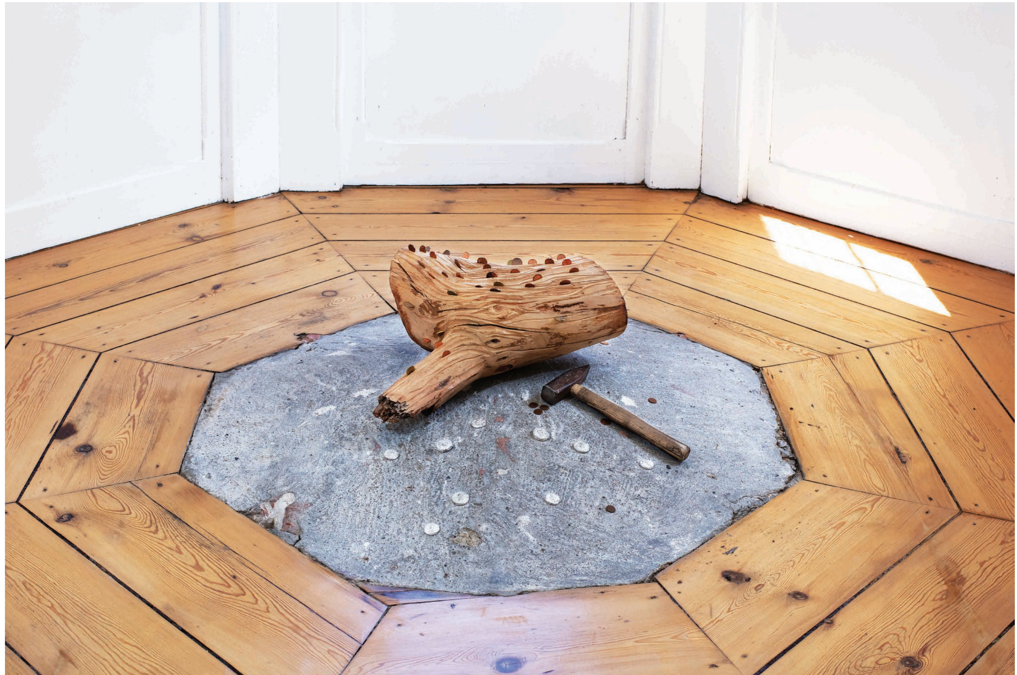
Wish tree, 2019, Conifer, money, wishes, hammer, 45 x 30 cm Location: Exhibition Kompromiss, LabKalkhorst, DE