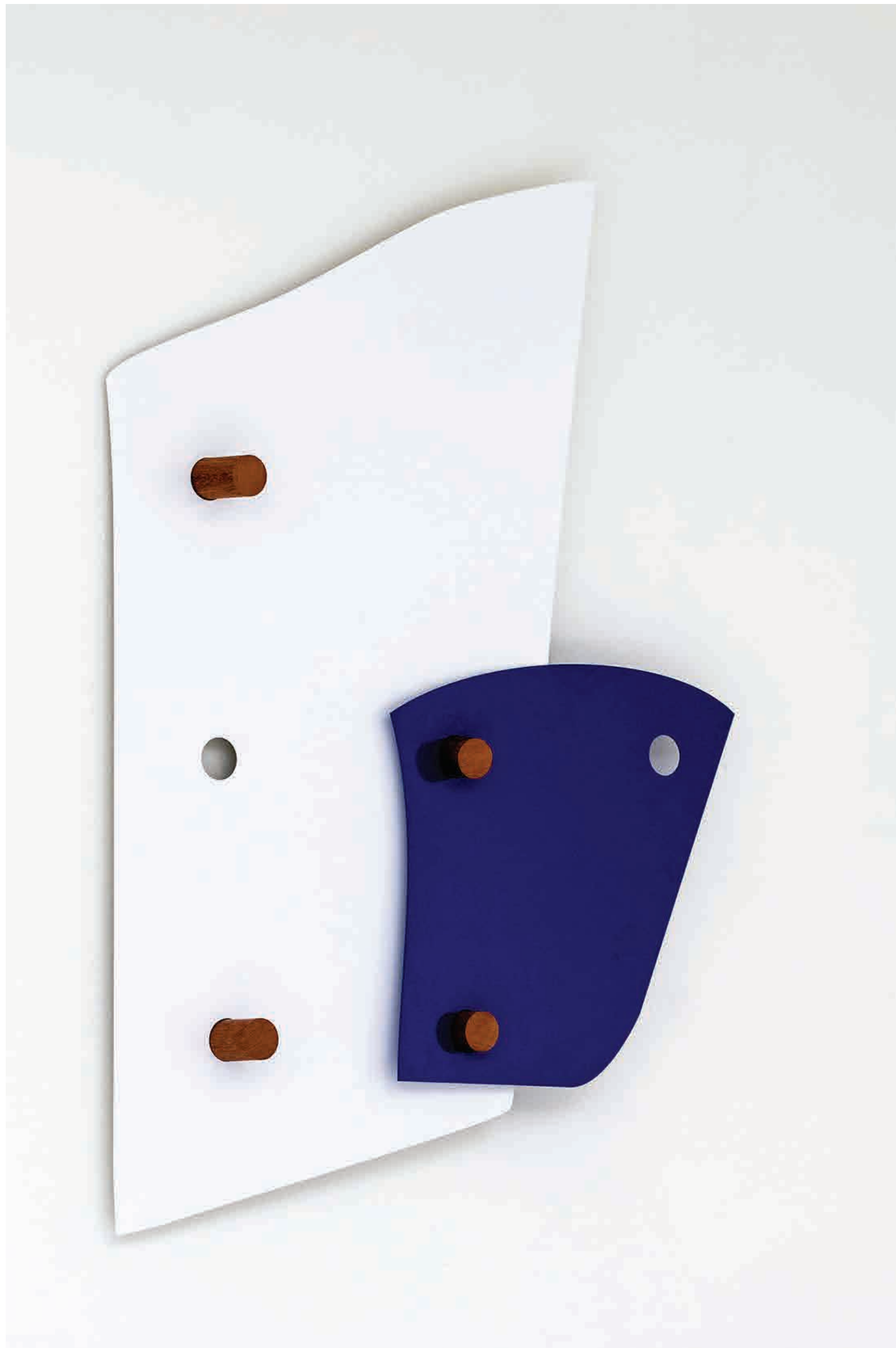
Move 2, from the series Shapeshifters 110cm × 85cm Cold-formed steel, Powder coat, Meranti wood 2017