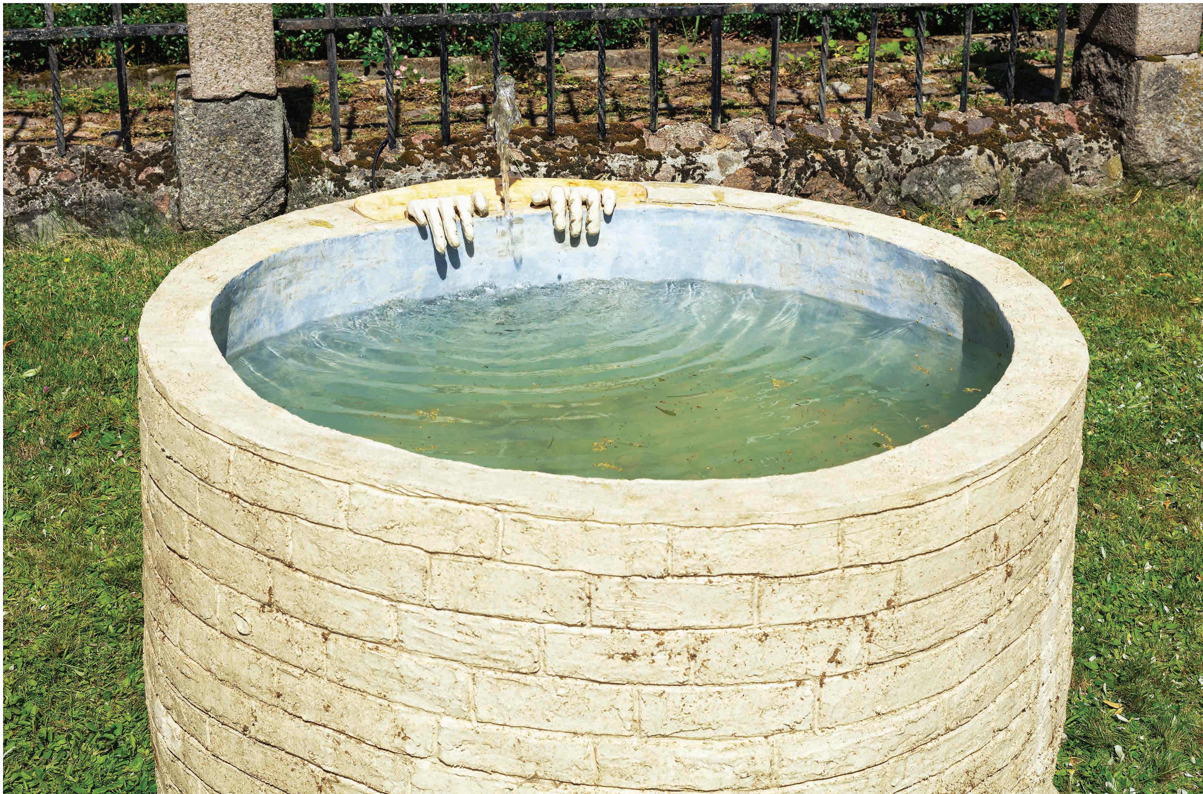
Well, by Bernice Nauta en Suzie van Staaveren 2019, ceramics, wood, water, money, 140x140x80 cm, Location: Exhibition Kompromiss, LabKalkhorst, DE