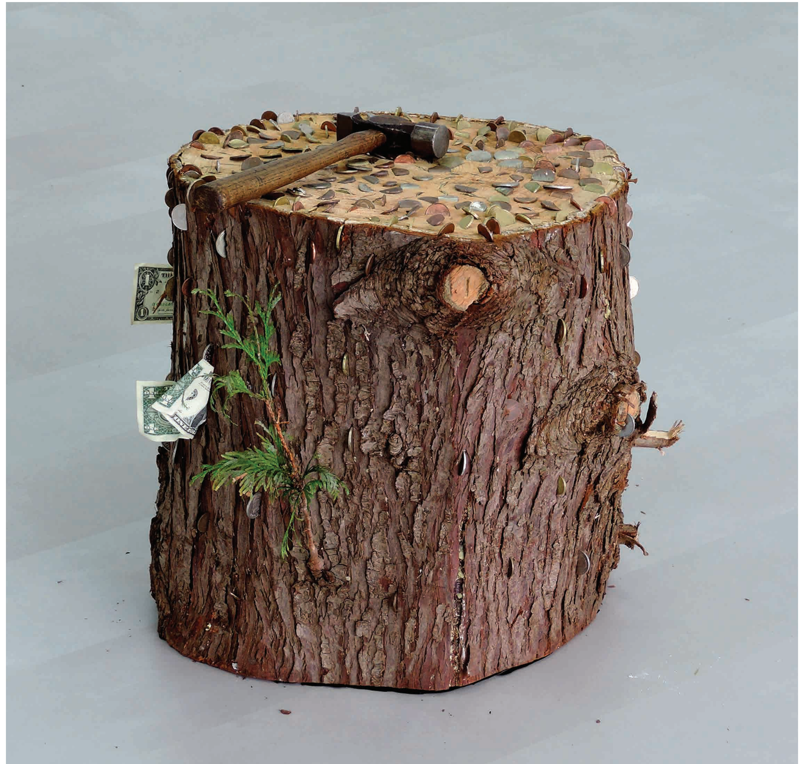
Wish tree, 2019, Conifer, money, wishes, hammer, 50 × 60 cm, Location LxHxB, Eindhoven, NL