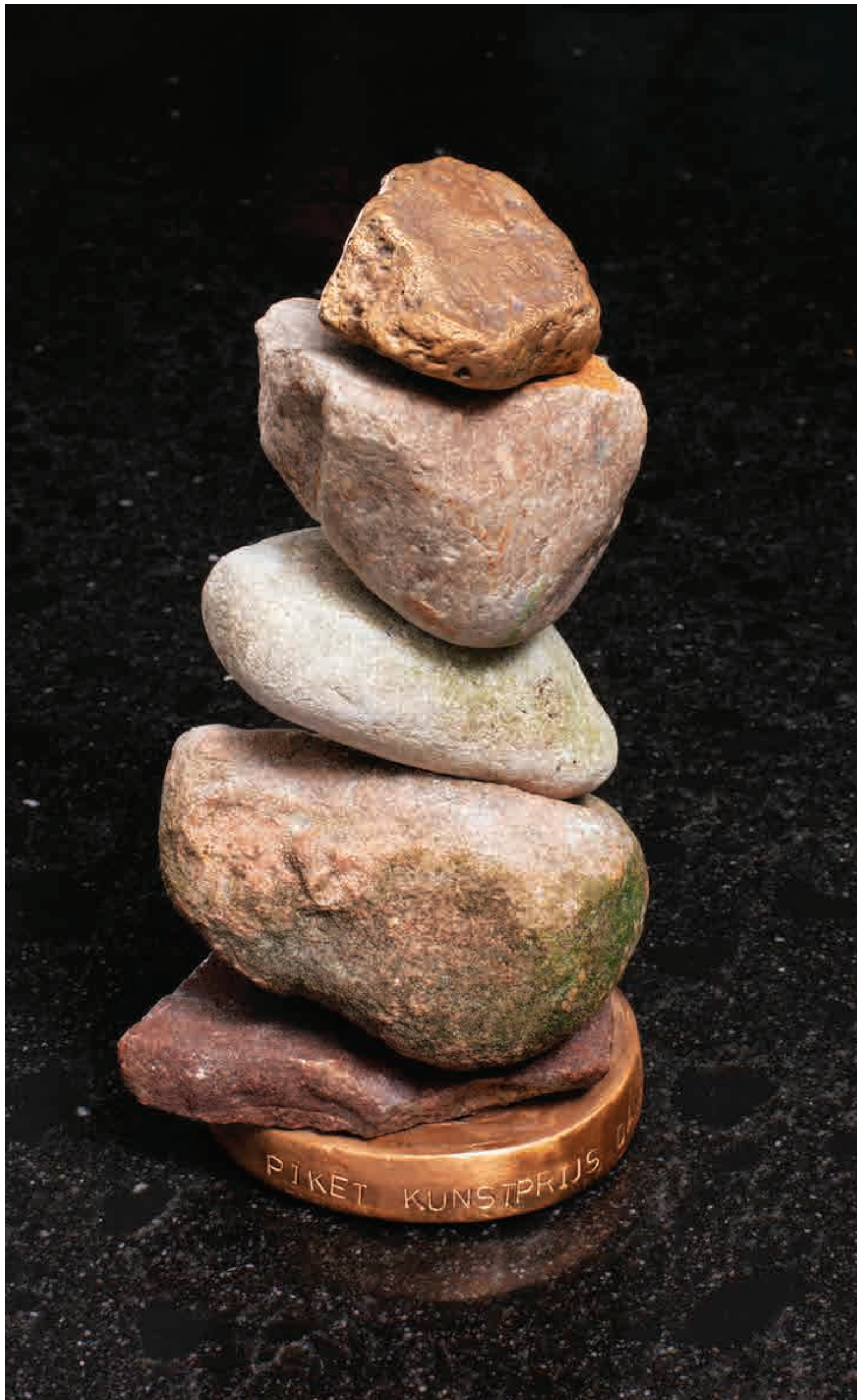
Award sculpture for Piket Kunstprijzen, 2020, Boulders, Bronze