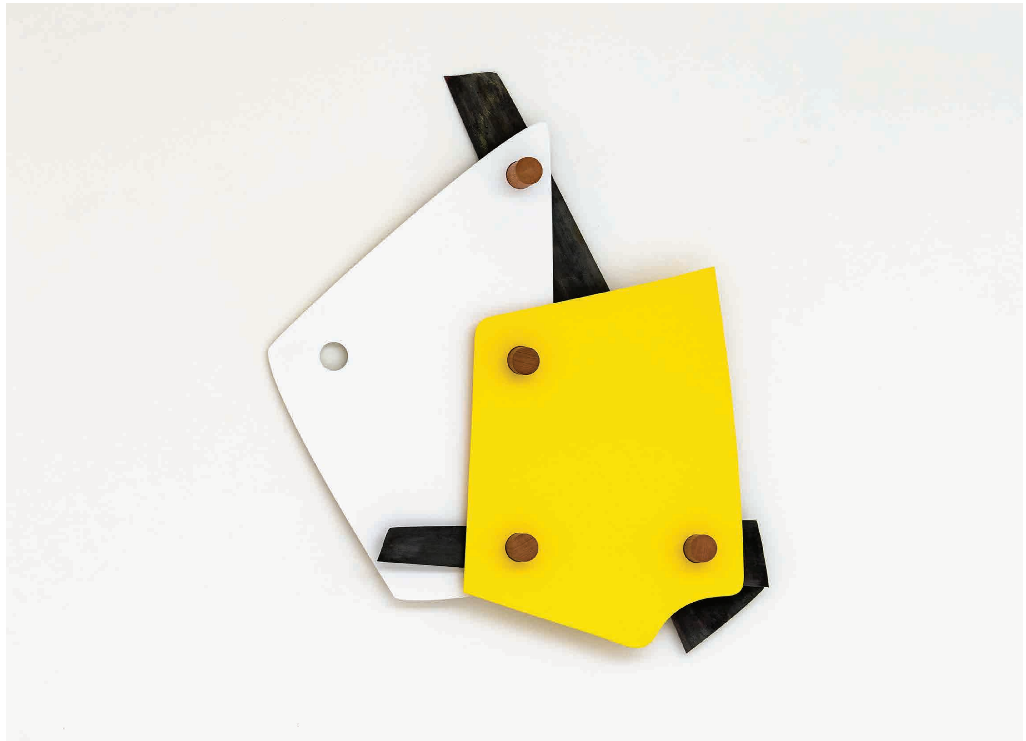
Move 1, from the series Shapeshifters 75 × 85 cm Cold-formed steel, Powder coat, Meranti wood 2017