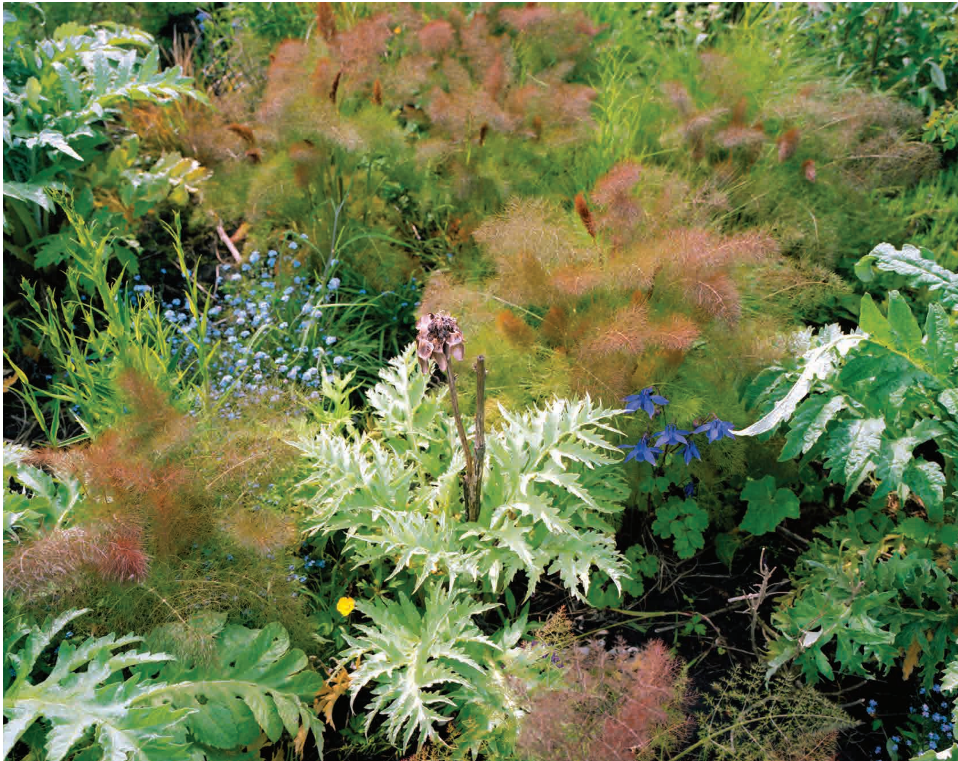
Plot project Aalsmeer, 2019 till now, ongoing material research project in gardening and plants