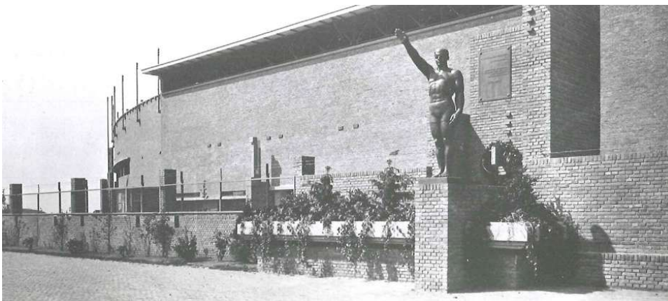
De Olympische Groet/Van Tuyll-monument bij het Olympisch Stadion in vroegere tijden.

Het beeld is geplaatst bij de Olympische Spelen in 1928. Kunstenaar Gerarda Rueb heeft een sportman met een gestrekte rechterarm afgebeeld, in de veronderstelling dat dit de Olympische groet verbeeldde. Omdat het beeld nadien vooral met het fascisme en nazisme werd geassocieerd, wat tot protesten leidde, heeft de eigenaar (VvE Olympisch Stadion) na historisch onderzoek in 2022 besloten het beeld uit de publieke ruimte te halen en in het trappenhuis van het stadion te plaatsen. Dit is een voorbeeld van de handelingsoptie 'verplaatsen'.